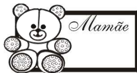
cartão pequeno p&B

4 - A caixinha guardará, no seu interior um cartão, ele poderá ser escolhido entre um dos modelos que poderá ser acessado e impresso clicando um dos seguintes ícones (novamente se a escolha for pelo branco e preto pintá-lo antes da montagem e suas cores podem combinar com a caixinha)